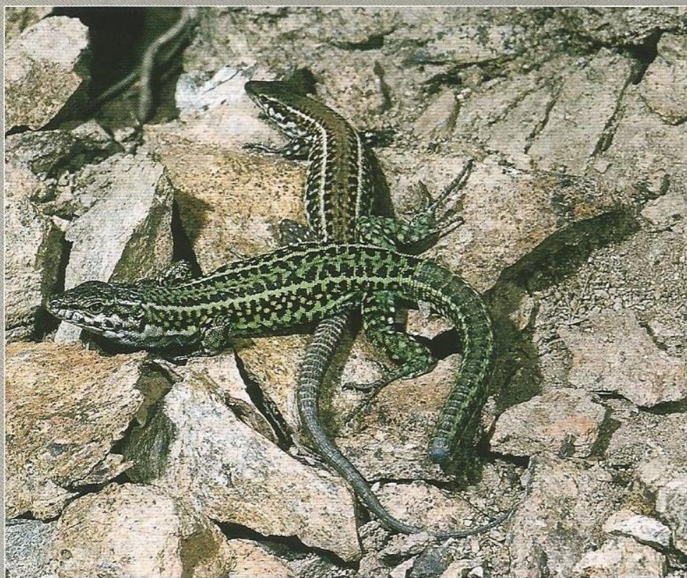
Coppia di lucertole tirreniche (Gennargentu)

Annual activity cycle - The species is thought to be active, in general, from February to November. It can, however, be seen on particularly warm days in winter.