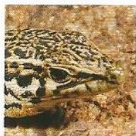
Lucertola tirrenica Tyrrhenian wall lizard