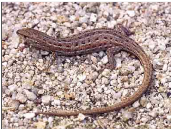
Ejemplar del Delta del Llobregat (Barcelona)

Se desconocen cambios recientes en la distribución general pero se ha constatado su desaparición de algunas zonas norteñas como los Aiguamolls de l'Empordà (Girona) donde estaba presente a princi-