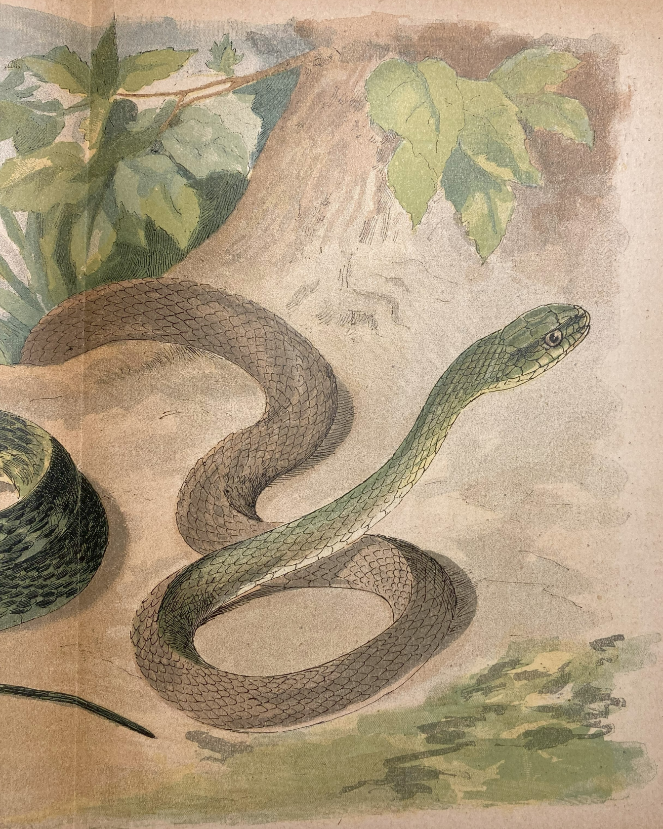
Couleuvre de Montpellier ( Cœlopeltis insignitus )