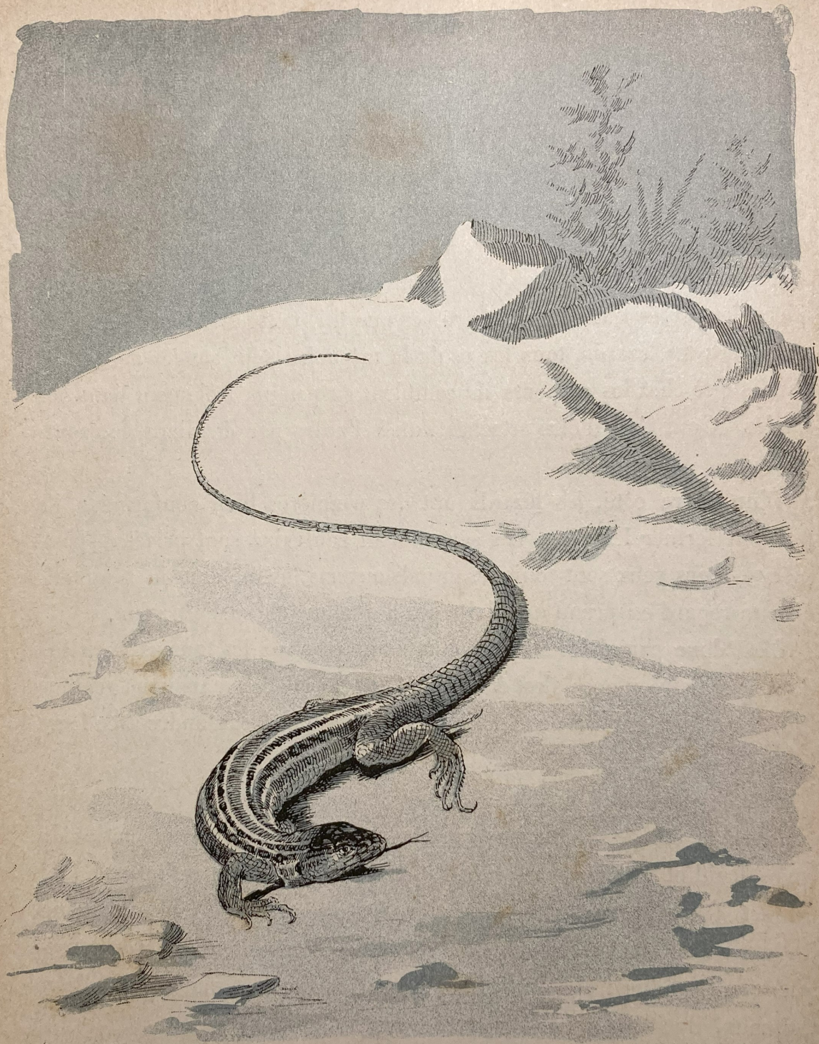
Acanthodactyle ( Acanthodactylus vulgaris ).