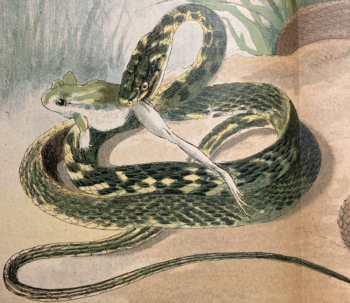
Couleuvre verte et jaune ( Zamenis viridi-flavus )