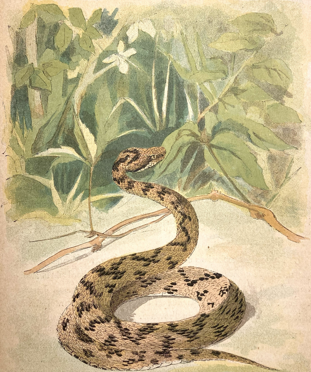
Vipère aspic ( Vipera aspis )