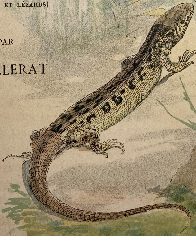
Lezard des souches ( Lacerta stirpium )