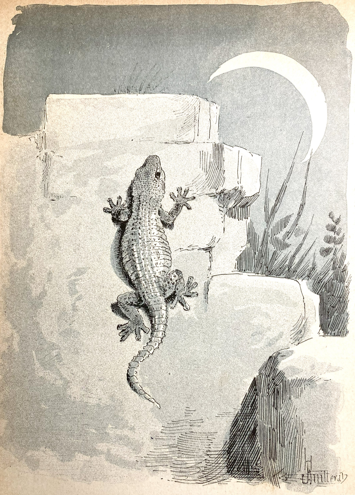
Gecko ( Platydactylus muralis ).