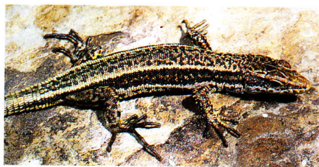
Lagartija pallaresa, macho (Mont-roig, Lérida).

Los recién nacidos son de color gris, pardo oscuro o negruzco, a veces manchado de negro, con costados negros. Vientre blanquecino o amarillento y cola verde brillante. La coloración ventral amarilla es ya visible a partir del segundo año de vida.