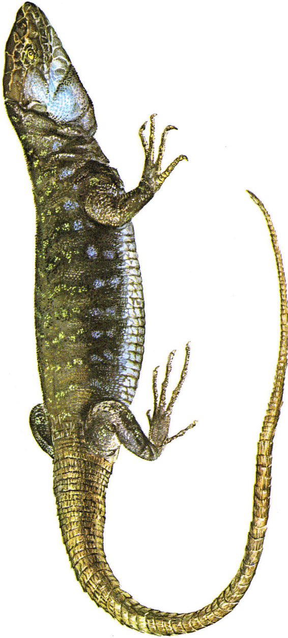
Lagarto tizón ( Lacerta galloti )