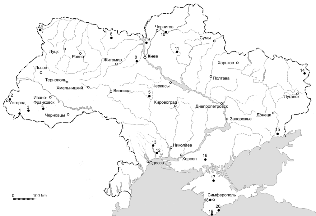
Рис. 1. География исследованных выборок L. agilis .