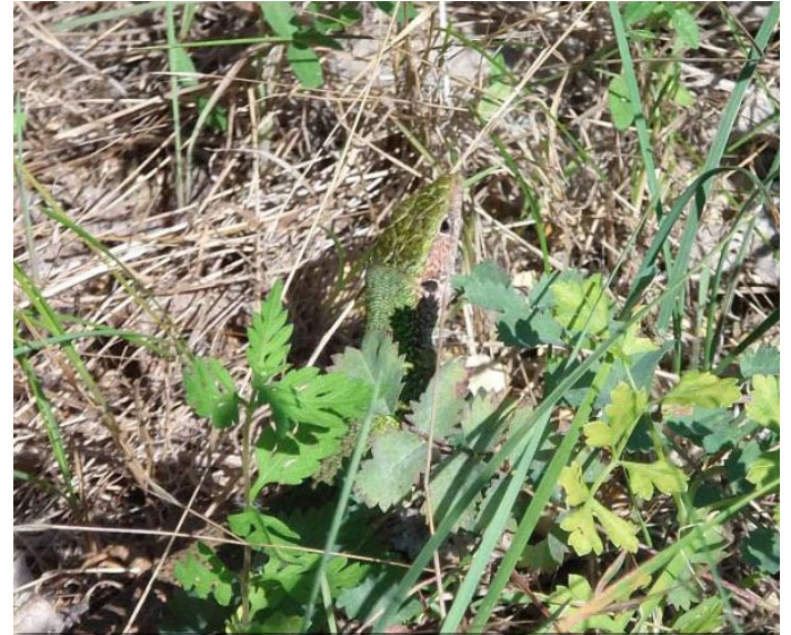
Östliche Smaragdeidechse ( Lacerta v. viridis ), männlich

Gyenesdias ist ein kleiner Vorort von Keszthely und ein beliebtes Ferienziel am Westbalaton (Ungarn). Neben einem herrlichen Badestrand, an dem sich die Familie vergnügen kann und die eine oder andere Würfelnatter ( Natrix tessellata ) für Aufregung sorgt,