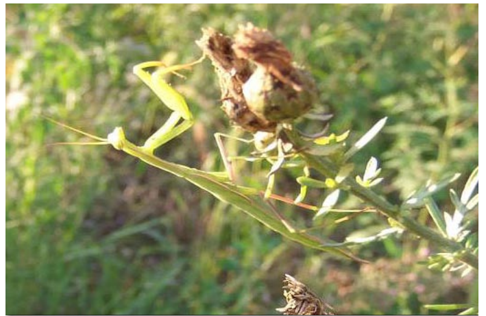
Gottesanbeterin ( Mantis religiosa )