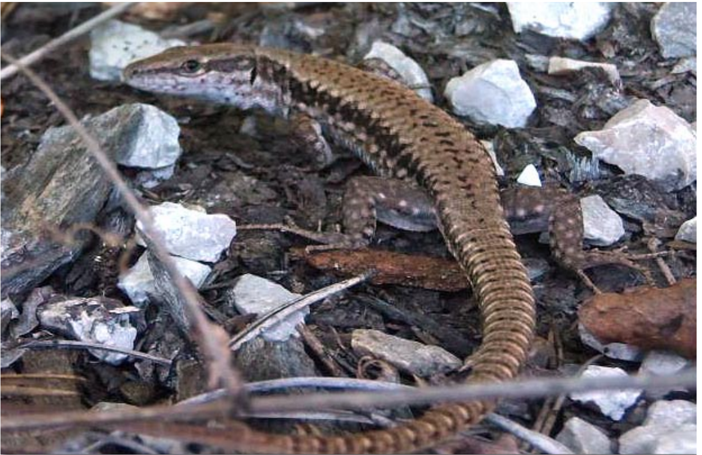
Mauereidechse ( Podarcis muralis muralis ), männlich

Smaragdeidechsen beobachten. Auffällig war das sehr gute Futterangebot in Form diverser Ödlandschrecken. Häufig waren auch die Gemeine Gottesanbeterin ( Mantis religiosa ) und die Schwarzbäuchige Tarantel ( Hogna radiata ) zu sehen. Beide dürften anhand ihrer Größe auch als Prädatoren von juvenilen Mauereidechsen infrage kommen.