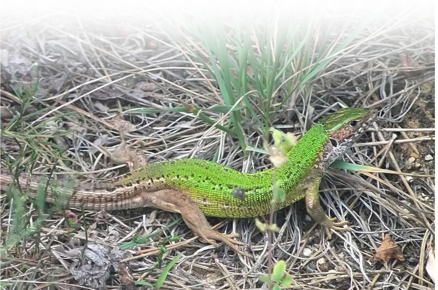
Östliche Smaragdeidechse ( Lacerta v. viridis ), weiblich

gibt es in Richtung Berge am Rand von Gyenesdias einen interessanten Steinbruch. Dieser ist gut mit dem Auto zu erreichen und mit Wanderwegen erschlossen.