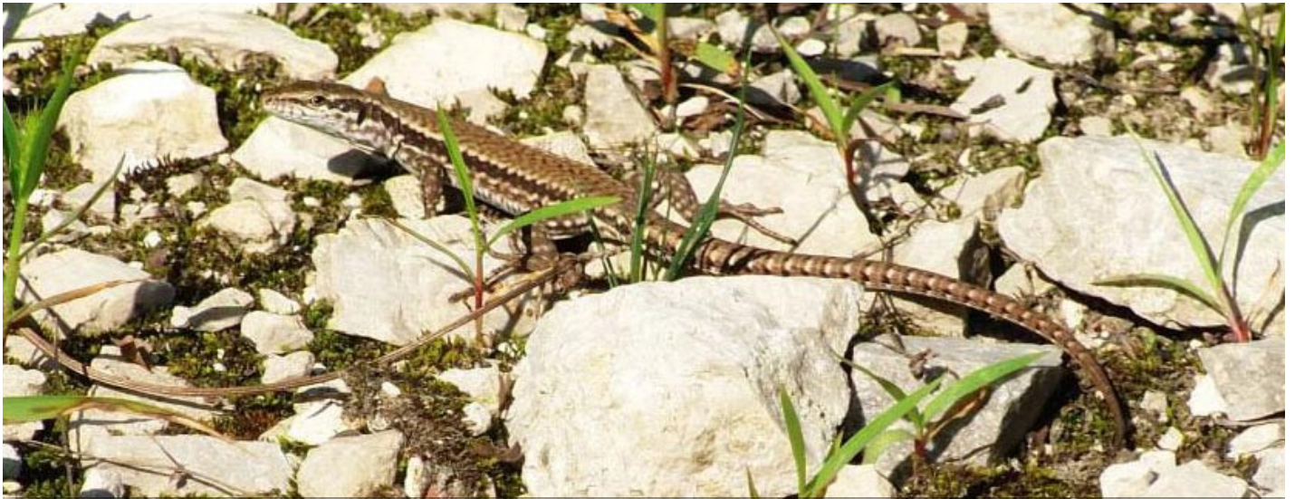
Mauereidechse ( Podarcis m. muralis )