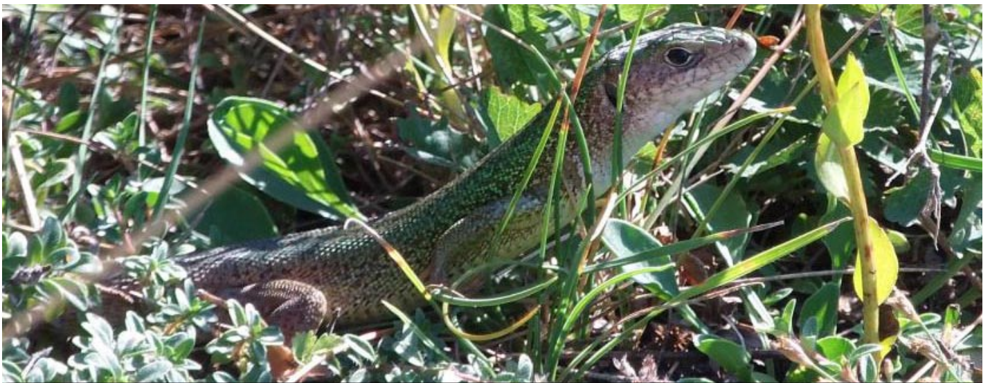
Östliche Smaragdeidechse ( Lacerta v. viridis ), männlich

Auffallend war die teilweise sehr geringe Fluchtdistanz der Smaragdeidechsen. So konnte man sich ihnen teilweise bis auf einen halben Meter nähern. Das dürfte daran liegen, dass sie die Nähe des Menschen wohl gewohnt sind, da der