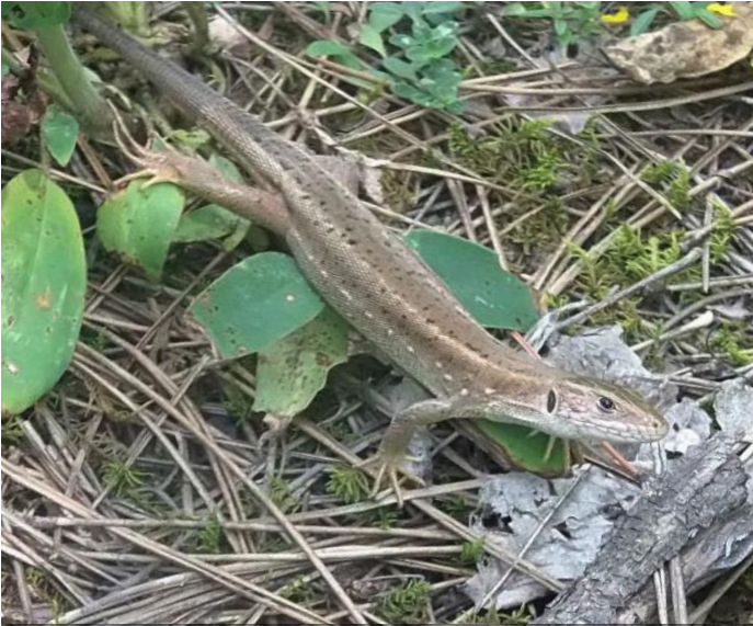
Östliche Smaragdeidechse ( Lacerta viridis viridis ), Jungtier