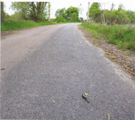
Abb. 1: Fundort der drei Zauneidechsen (Vordergrund) auf der Pflasterstraße in Werbig/ Landkreis Märkisch Oderland.

Am 07.05.2015 machte ich im Rahmen meiner beruflichen, gutachterlichen Tätigkeit in der Nähe des Bahnhofes Werbig (LK MOL) eine ungewöhnliche Beobachtung. Auf der „Pflasterstraße“, einer asphaltierten Straße parallel zur Bahnlinie Werbig-Seelow (Abb. 1), wurden drei Individuen der Zauneidechse tot aufgefunden. Es handelte sich um ein adultes Männchen, ein adultes Weibchen und ein vorjähriges Jungtier (Abb. 2). Die Tiere wiesen punktförmige Wunden auf (Weibchen in der Bildmitte und Jungtier rechts im Bild). Die Tiere zeigten keine Spuren eines Todes durch Überfahren. Als Todesursache kommt aus meiner Sicht einzig ein Prädator in Frage, der die Tiere auf der Straße wieder herausgebracht hat. Ob die Wunden die Todesursache waren und ob diese durch Zäh-