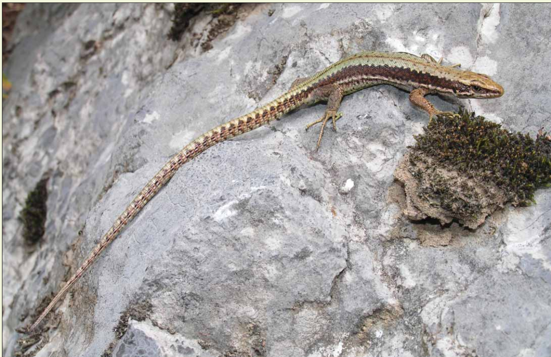
Slika 79. Velebitska gušterica/ Horvath's Rock Lizard/ Iberolacerta horvathi

Rasprostranjenost u svijetu i u Hrvatskoj: Velebitska gušterica je planinska vrsta rasprostranjena na uskom pojasu koji se proteže od istočnih Alpa do sjevernih Dinarida (Radovanović, 1964). Prisutna je u Alpском dijelu Italije, Slovenije, Austrije i Njemačke. U Sloveniji je do sada zabilježena u Julijanskim Alpama, Trnovskom gozdu, Snežniku, Dovžanskom Gorgu, planinama Karavanke te u Dinaridima (Krofel i sur., 2009; Cafuta, 2010). Ova vrsta je opisana s područja Jasenka (Mertens i Müller 1928) te se prvotno smatralo da nastanjuje samo područja Gorskog kotara i Velebita, no kasnije je pronađena i na području Plitvica (Karaman, 1921) i Učke (Mertens, 1937). Tijekom posljednjeg desetljeća, velebitska gušterica je pronađena na velikom broju novih lokaliteta (Cabela i sur., 2002, 2004; Žagar i sur., 2007; Žagar, 2008; Krofel i sur.,