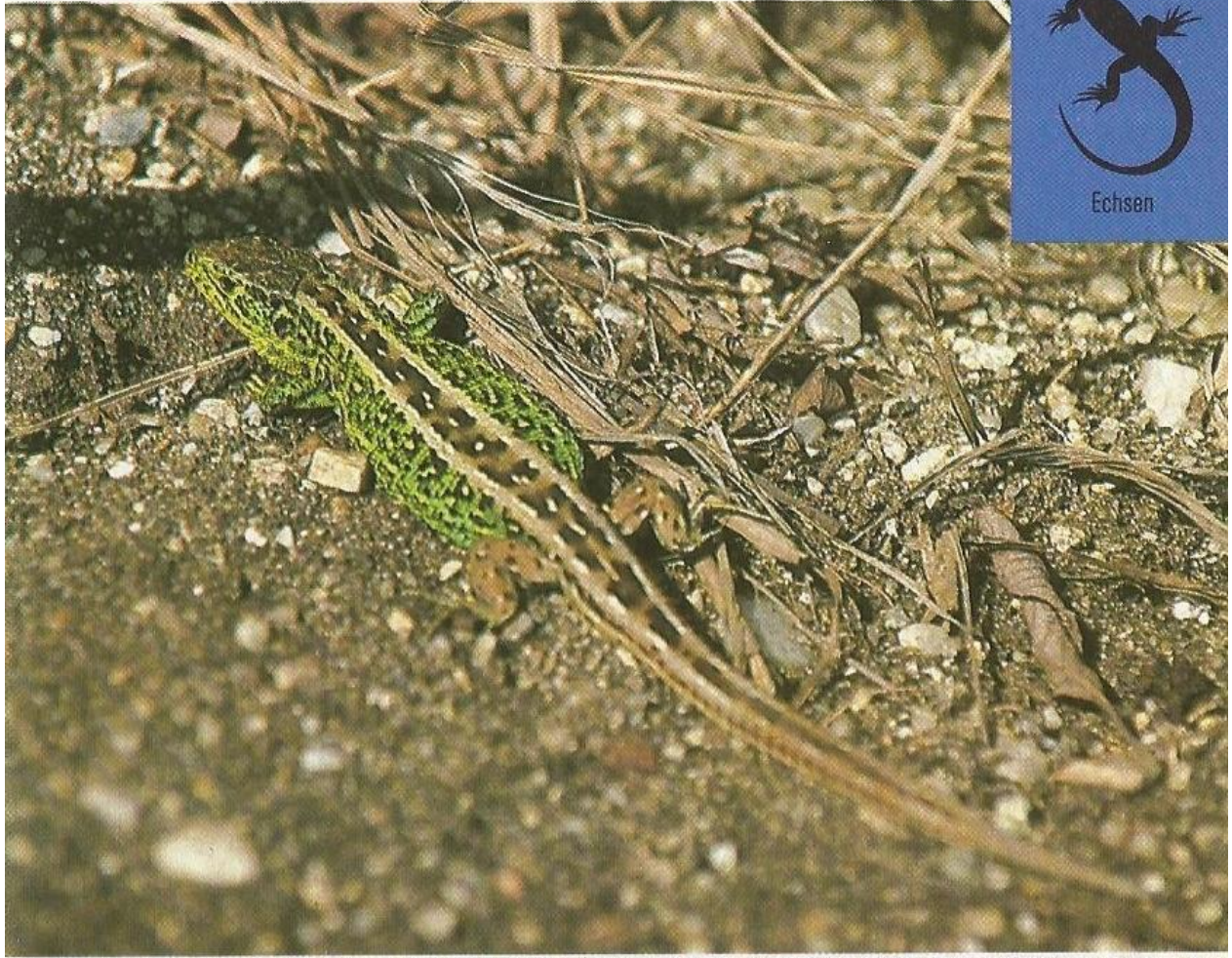
Typisch gefärbtes ♂