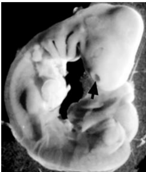
Рис. 1. Ембріон 28 стадії ембріонального розвитку L. agilis . Стрілкою позначено нюхову ямку.

В результаті інвагінації нюхових плакод відбувається формування нюхові ямки (рис. 1).